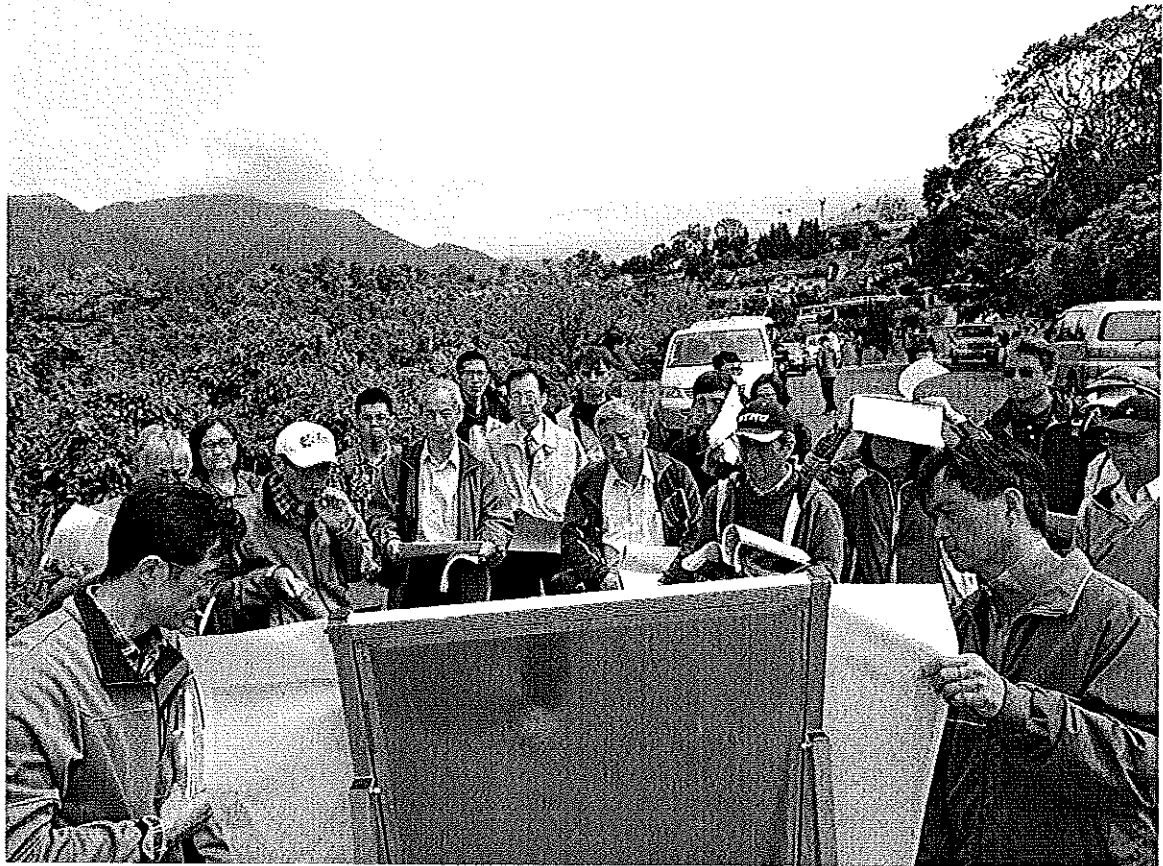
林務局羅東林區管理處辦理台北市境內編號第 3009 號風景保安林檢訂結果擬解除保安林一部面積 9.171665 公頃案保安林現勘及審議委員會照片