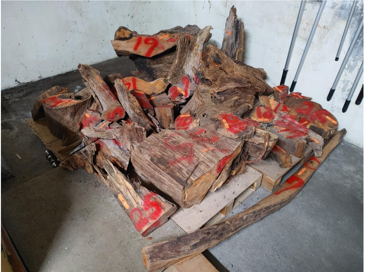
112 宜賦 13-2 號 林產物相片