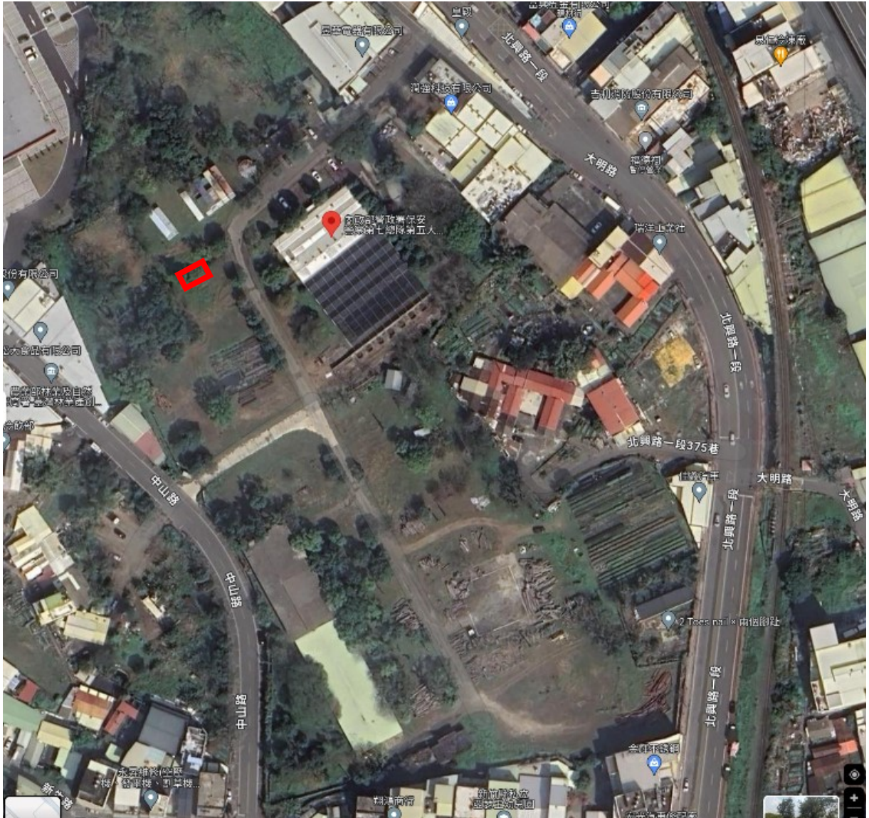
地點：新竹分署竹東貯木場